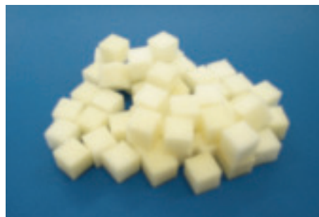
エンバイロ・フォーム